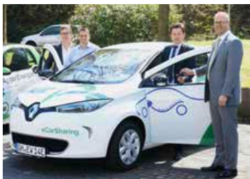
E-Carsharing: AggerEnergie bietet Kommunen einen „Rundum-sorglos“-Service an.

einspart. Je zwei Dienst-E-Bikes inklusive Ladestationen und Gratisstrom stellt AggerEnergie den Kommunen und dem Oberbergischen Kreis zur Verfügung. Auch wer sich privat ein E-Bike kauft, erhält bis zu 100 Euro Prämie. Wiehl und Engelskirchen haben mit Unterstützung von AggerEnergie erfolgreich ein E-Carsharing-Modell eingeführt. An zehn Ladestationen im Versorgungsgebiet tanken Elektroauto-Pioniere kostenlos Naturstrom, der teils aus dem Wasserkraftwerk an der Aggertalsperre kommt. 2.723.022 Kilowattstunden regional erzeugten Ökostrom lieferte AggerEnergie an die Kunden. Das Unternehmen hat ein Energiemanagementsystem gemäß DIN EN ISO 50001 eingeführt und unterstützt jetzt auch andere Betriebe dabei, ihre Energieeffizienz systematisch zu verbessern. Dazu wurde ein Dutzend Mitarbeiter zum „Energiemanager 2.0“ qualifiziert.