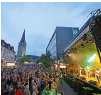
Auch als Veranstalter, wie hier beim Lindenplatz-Open-Air, bringt AggerEnergie Lebensqualität in die Region.

Seit mehr als 90 Jahren ist AggerEnergie das Gemeinschaftsstadtwerk im Oberbergischen Kreis und in Overath. In zehn Städten und Gemeinden mit insgesamt mehr als 220.000 Einwohnern versorgt das Unternehmen die Menschen verlässlich, sicher und fair mit Energie, teils auch mit Trinkwasser. Dafür setzen sich die Mitarbeiterinnen und Mitarbeiter Tag für Tag ein.